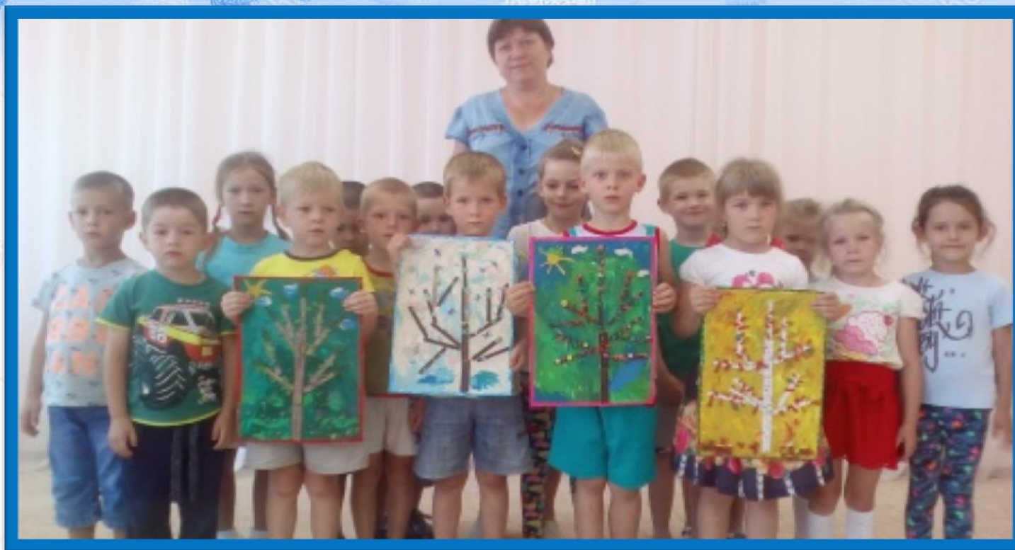
Панно «Деревья в разное время года»