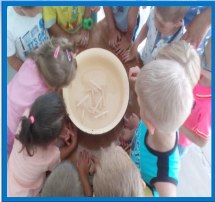
Палочка для мороженого деревянная, не тонет